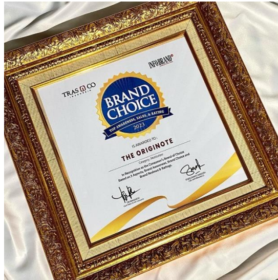
Gambar 1. Penghargaan Brand Choice Award 2023

Meskipun The Originote masih merupakan merek baru, produk ini sudah berhasil bersaing dengan merek-merek besar lainnya. Tentunya untuk mendapatkan posisi yang seperti ini tidaklah mudah. The Originote selalu mengevaluasi produknya agar penjualannya dapat meningkat dan produknya dikenal oleh masyarakat. Pada penelitian sebelumnya, peneliti hanya meneliti moisturizer The Originote yaitu Hyalucera moisturizer dengan kandungan Hyaluron, ceramide dan chlorelina. Peneliti sebelumnya hanya meneliti tekstur kualitas produk tanpa melibatkan harga di dalamnya. Moisturizer tersebut dibandrol dengan harga kisaran Rp 42.000 untuk kemasan 50 ml. Penelitian sebelumnya hanya fokus pada moisturizer dan mengabaikan produk lainnya padahal The originote kini telah memiliki kurang lebih 20 produk (Rokhim & Riyanto, 2024).